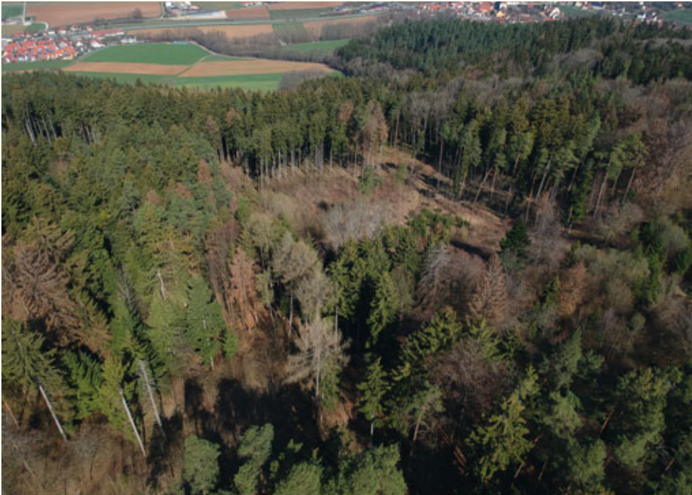
Massive Borkenkäferschäden am Mitteldorfer Berg, zwischen Igensdorf und Weißenhohe (Aufnahme von 2019) siehe Artikel »Käferholzaufarbeitung und Wiederaufforstung«, Seite 4.