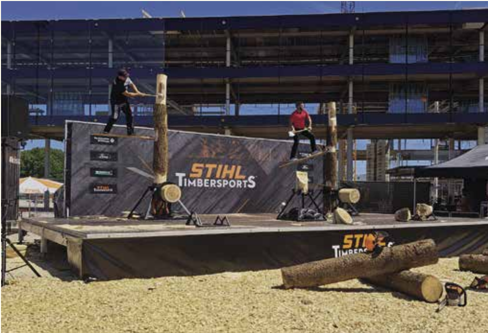
Messe INTERFORST – STIHL Timbersports Lesen Sie unseren folgenden ausführlichen Artikel zur Lehrfahrt.